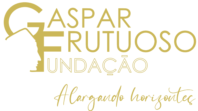
Versão Assinatura Vertical