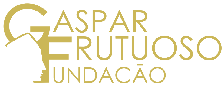
Versão Logo Cheio