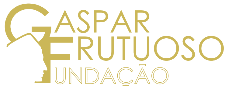
Versão Logo Vazado