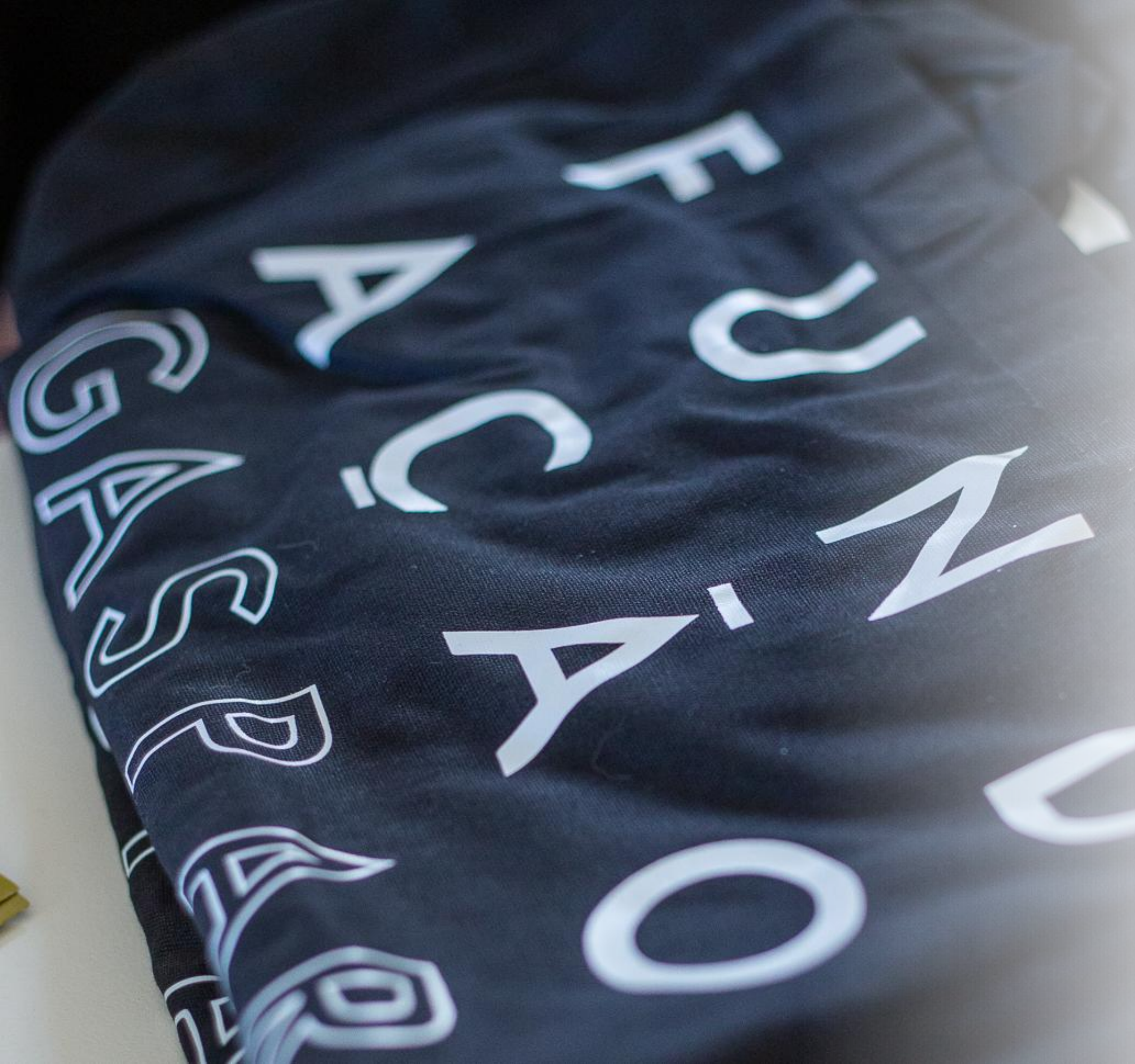
IMAGEM E COMUNICAÇÃO